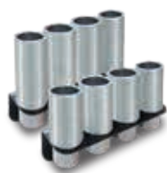
Nostoholkkisarja 4 x 89 mm ja 4 x 127 mm Tilausno FJ7880 BK