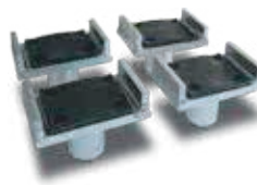
U-adapterisarja rungollisille ajoneuvoille Tilausno FJ6173