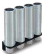
Nostoholkkisarja 4 x 200 mm Tilausno FJ6172 BK