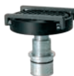
Liukueste dia.120 mm Tilausno FS 6353-1